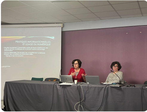
Table-ronde : « Penser le changement climatique »